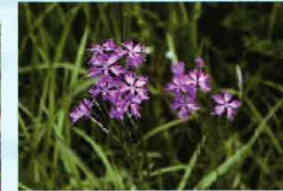
阿蘇の生き物と共に