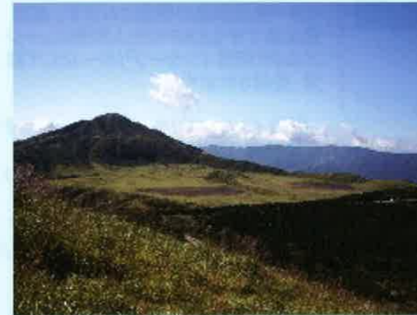
草千里ヶ浜は火口の跡？