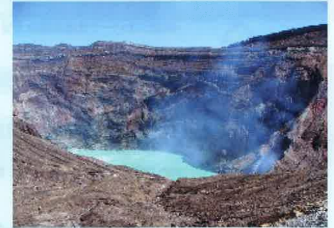
世界でも珍しい火口の湯だまり